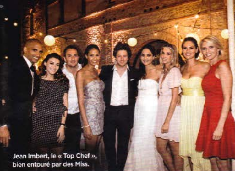
Jean Imbert, le « Top Chef », bien entouré par des Miss.