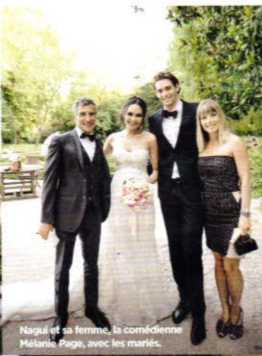
Nagui et sa femme, la comédienne Mélanie Page, avec les mariés.

Comme Alexandra Rosenfeld, témoin de Valérie, chacun y est allé de son petit mot tendre pour les époux. En souvenir de l'événement, les invitées ont toutes eu droit à un petit pot de miel de lavande fabriqué dans la région. Particularité du dîner : le dessert attribué aux femmes était une religieuse aux fruits rouges, et pour les hommes, trois verres empilés contenant de l'ananas, une soupe de kiwis et des framboises.