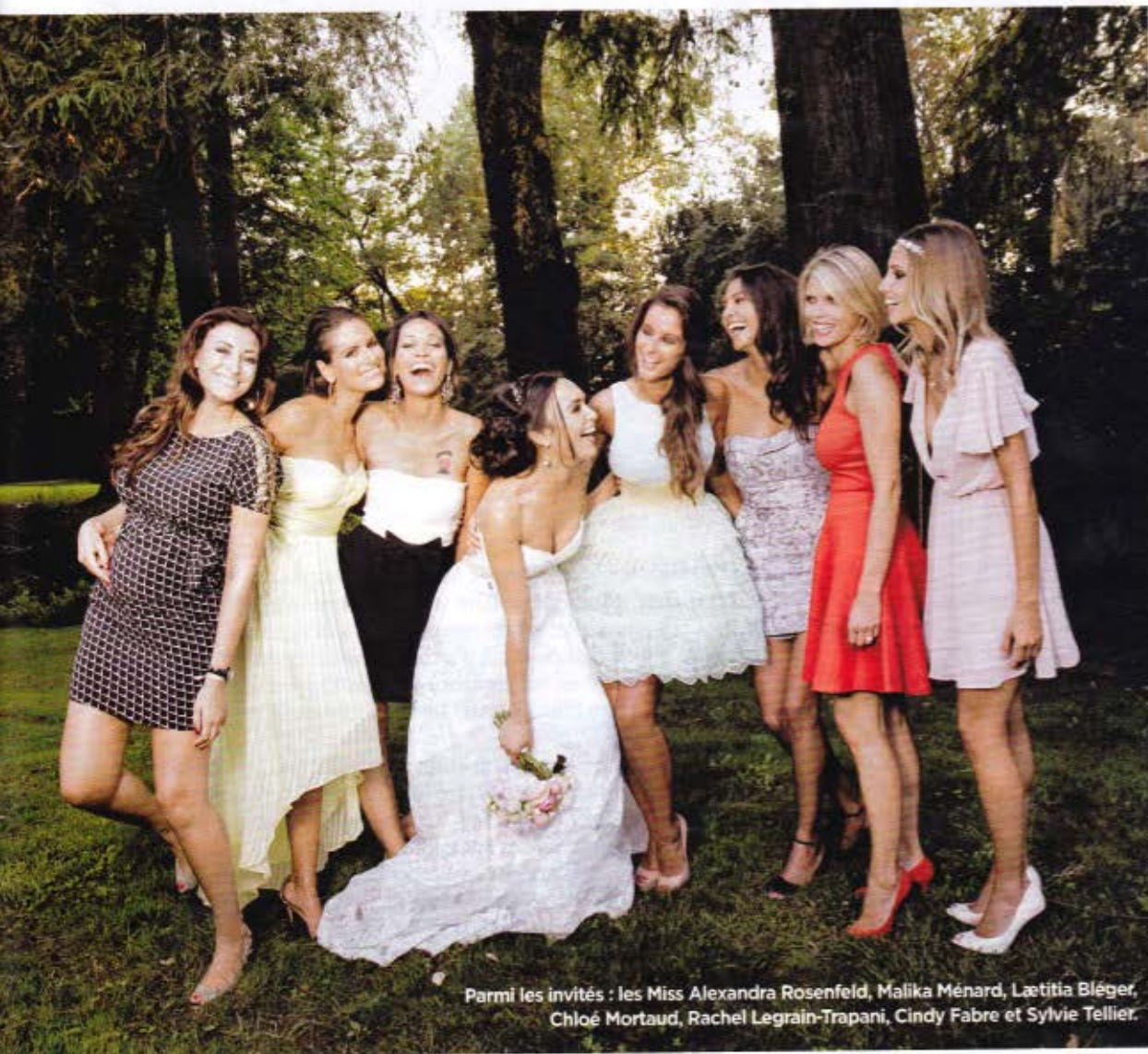
Parmi les invités : les Miss Alexandra Rosenfeld, Malika Ménard, Lætitia Bléger, Chloé Mortaud, Rachel Legrain-Trapani, Cindy Fabre et Sylvie Tellier.